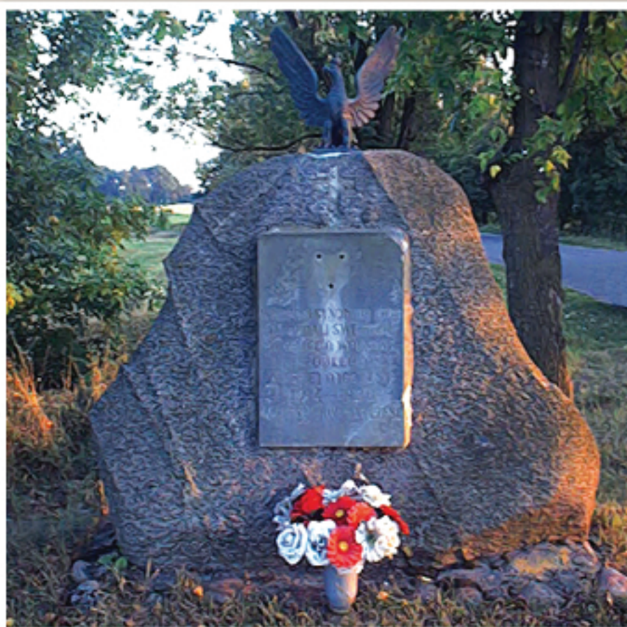
Pomnik bohaterów wojny, 1914 r.

Wierzbica Pańska – nilyn wodny z pocz. XX w.