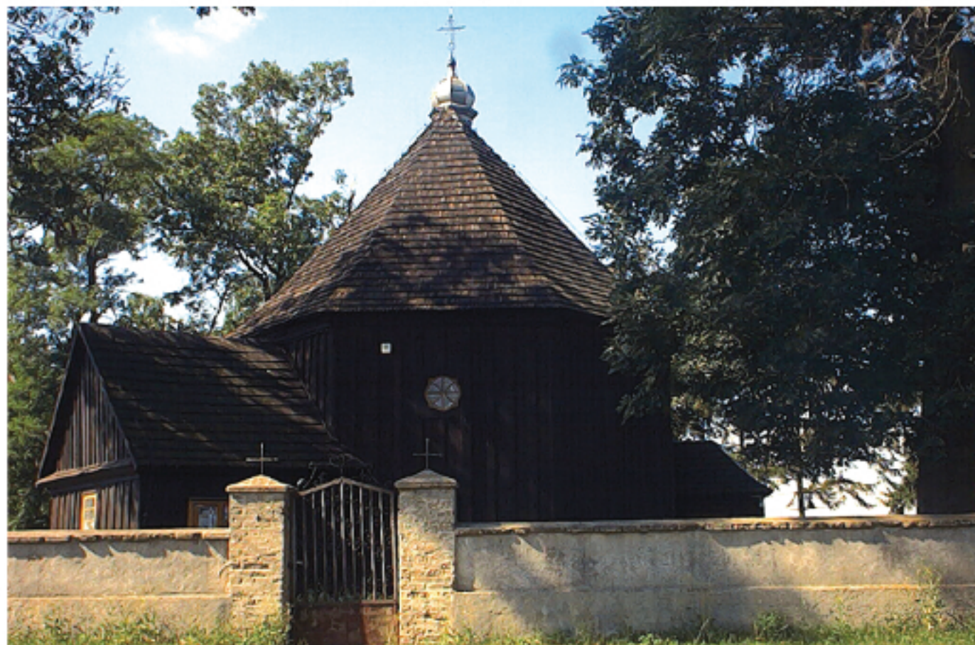
Kościół w Kucicach

tel. 0 23 661 59 04 fax 0 23 661 55 10, e-mail: ug_sekretariat_dzierzaznia@wp.pl www.dzierzaznia.pl