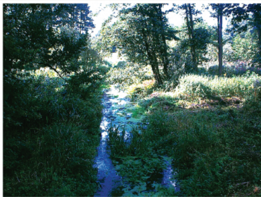
Dziewicze tereny nad rzeką Żurawianką

Atrakcjami turystycznymi w rejonie gminy Dzierżążnia są zabytki kultury polskiej oraz piękno krajobrazu nizin mazowieckiej. Dodatkowym atutem regionu jest ciągła poprawa środowiska naturalnego, co owocuje pojawieniem się zwierząt uznawanych za gatunki zagrożone – bobry i raki. Zwiększeniu populacji tych zwierząt sprzyja nieuregulowana rzeka Płonka i jej rozlewisko we wsi Wierzbica Pańska w pobliżu młyna.