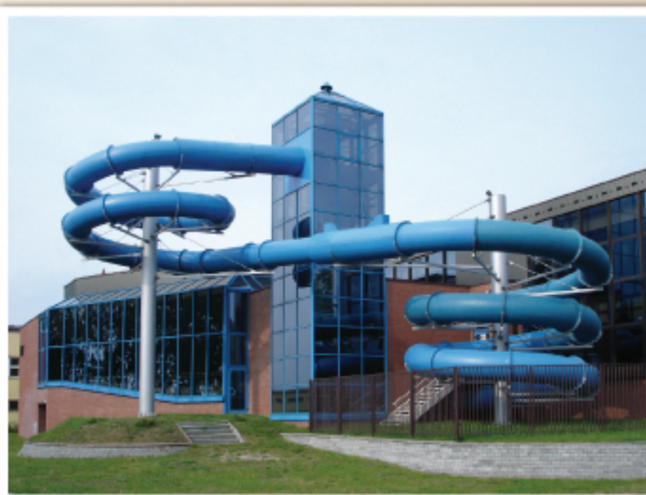
Miejskie Centrum Sportu i Rekreacji

Pizzeria Roma ul. Grunwaldzka 2; tel. 0 23 662 87 70