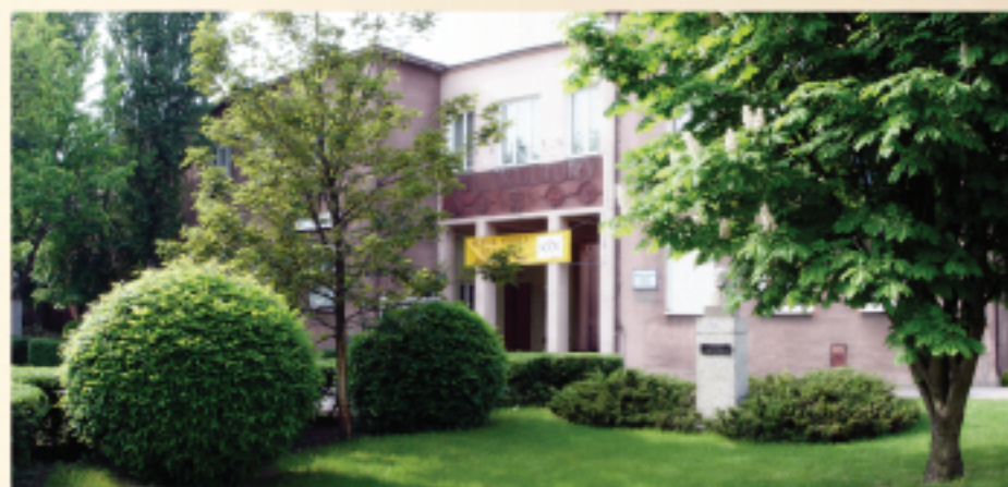
Miejskie Centrum Kultury