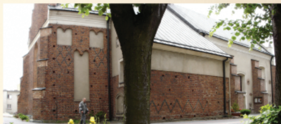
Kościół p.w. Wniebowzięcia NMP

Pizzeria Verona ul. Wolności 22; tel. 0 23 662 64 36